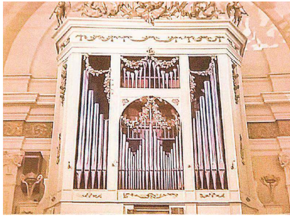
A sinistra l'organo Ghilardi del 2011 del conservatorio Campiani; a destra l'organo Montesanti 1799/Tonoli 1861 di Poggio Rusco, non modificato dopo la riforma di San Pio X