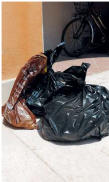
Stop ai sacchetti per le strade in centro città

Stop ai sacchetti in strada Da ottobre i cassonetti