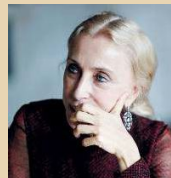
Franca Sozzani sul grande schermo all'Ariston

MANTOVA Lunedì e martedì alle 21.10, verrà proiettato presso la multisala Ariston Franca: Chaos and Creation, il docu-film su Franca Sozzani girato dal figlio Francesco Carrozzini pochi mesi prima della scomparsa dell'ex direttore di Vogue Italia, presentato alla scorsa edizione della Mostra del Cinema di Venezia e premiato a giugno col Nastro d'Argento. Profondo e spesso emotivo, il film è la lettera d'amore di un figlio: così il regista ci accompagna dietro le quinte del processo creativo di sua madre, icona assoluta nel mondo della moda, come anche negli angoli più intimi delle sue vulnerabilità. Costruiscono la sua personalità le interviste a Franca stessa, nonché a Karl Lagerfeld, Bruce Weber, Baz Luhrmann, Naomi Campbell, Marina Abramovic, Courtney Love, Donatella Versace e molti altri. Foto e vecchi filmati di momenti privati completano il quadro umano e professionale della Sozzani, la cui creatività ha per ventotto anni non solo infranto stereotipi e regole, ma costruito un nuovo status nella moda, nell'arte e nel business. «Volevo capire le sue scelte personali, avere un accesso privilegiato al